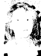
Christelle ZOLOTOFF Lyon