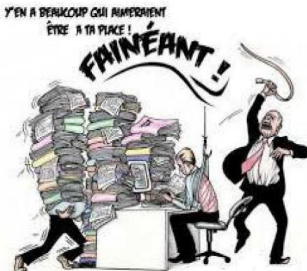
Coaching à Gerland

Sur le 2eme point, afin de sensibiliser les encadrants, cela se fera sous forme de coaching. Nul besoin d'être visionnaire pour savoir comment