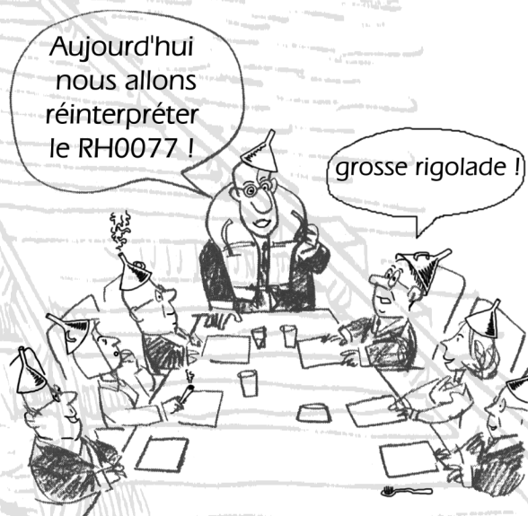
REUNION DE SPECIALISTES

Les cheminots de l'Équipement peuvent compter sur SUD-Rail pour ne rien lâcher sur nos conditions de travail actuelles et futures.