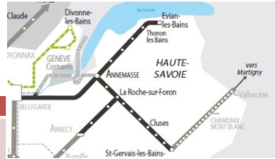
Projet de périmètre de la DDL CITI Rhodanien