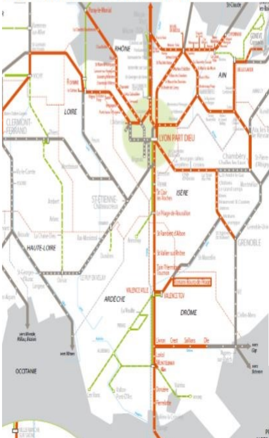
Projet de périmètre de la DDL Krono AURA